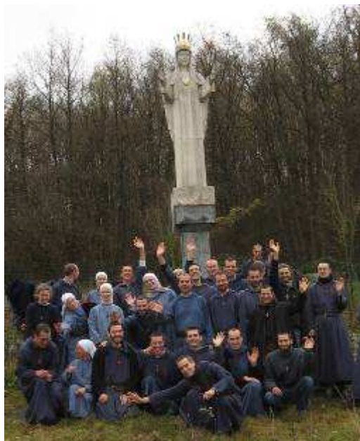
Broliai ir seserys keliavo aplankyti Boreno ( Beauraing ) Mergelės Marijos statulos prie autostrados, dėkodami už gražiai kartu praleistą kapitulą

Taip pat būkime gėrio detektoriai, pastebėkime Dievo ir žmonių gėrį. Šiais laikais egzistuoja dūmų detektoriai, kurių dėka išvengiama gaisro, o mes būkime gėrio ir grožio detektoriai kitų gyvenimuose. Žvelkime į kitus šviesos, supratimo kupinu žvilgsniu. Žvelkime skatindami kitame gėrį, kad meilės versmė, čiurlenanti kiekvieno žmogaus širdyje, išsiveržtų visu gaivumu. Pastebėkime mūsų artimųjų daromą pažangą, palaikykime ir padrąsinkime kiekvieną. Visą savaitę vyko mūsų nuostabioji kapitula, kupina tarpusavio įsiklausymo, vedant Šventajai Dvasiai. Tai buvo padėkos už 30 Tiberiados metų laikas. Ačiū už jūsų brangią maldą. Kapituloje žvelgėme į dabartį ir ateitį, gilinomės į mūsų charizmą, kaip gyventi labiau įsiklausant į Kristaus ir Bažnyčios kvietimą.