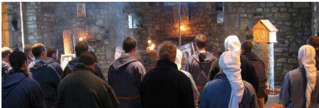
Kapitula taip pat buvo ir intensyvi maldos laikas, kad suvoktume Dievo valią mūsų bendruomenei