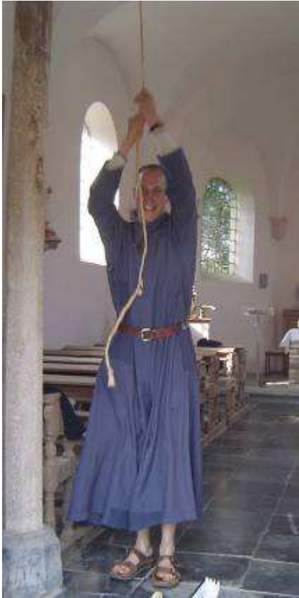
Džiaugu traukti virvę

padrąsinant. Gražiausiai bendradarbiavome tikriausiai tądien, kai turėjome išsiųsti savo darbus, artinantis egzaminams. Vienam ir kitam dar buvo likę daug skaitymo, tačiau vietoj to, kad kiekvienas skaitytų savąjį, nusprendėme skaityti ir