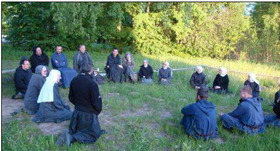
Broliškas susitikimas su broliais ir seserimis joanitais

bloga?“( Job 2,10b). Su prisikėlusiu Kristumi esame tikri gėrio ir gyvenimo pergale. Nauja žemė ir Naujas dangus jau ateina. Kristus yra čia, jis su mumis per visas dienas.