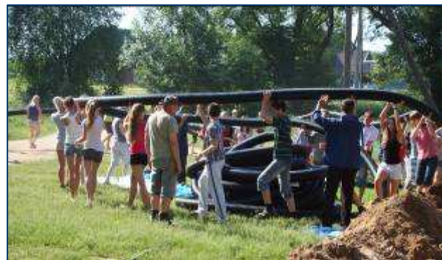
Nebeįmanoma išvynioti šiluminių vamzdžių. Bet ačiū Dievui 70 jaunuolių pagelbėjo.

Katilinė apšildys bažnyčią, taip pat ir kleboniją bei mokyklą. Buldozeriuku iškasėme griovius iki visų minėtų pastatų. Po to ėmėms tiesti ant didžiulės ritės susuktą 200m šilumtiekį: po 50m ritę taip užstrigo, kad nebebuvo įmanoma judėti toliau. Laimei, kitą dieną priėmėme 50 jaunuolių iš Kretingos ir 20 iš Panevėžio. Šių 70 jaunuolių dėka pajėgėme