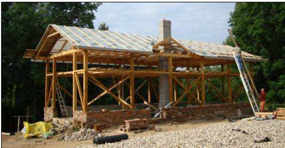
Statom katilinę bažnyčios, buvusios mokyklos ir klebonijos šildymui