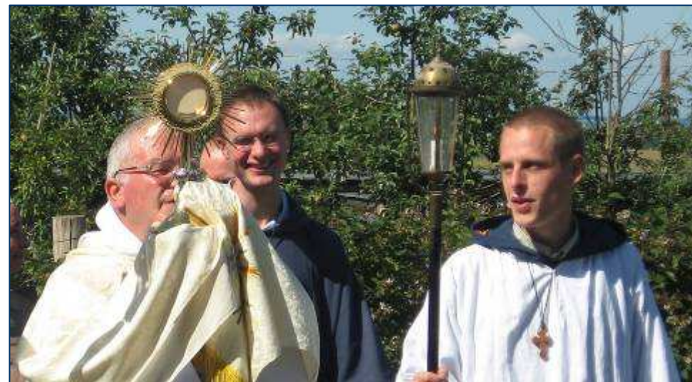
Procesija devintinių šventėje