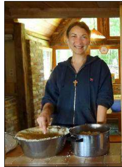
Šv. Jono Krikštytojo metai – tai žmogiško ir dvasinio augimo laikas.

Tuo metu brolis Egidijus jam tyliai sušnabždėjo, jog tai mūsų asilė prie durų skleidžia šį garsą. Po trumpos nuostabos akimirkos Eucharistija tęsėsi.