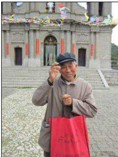
Jus sveikina Kinija!