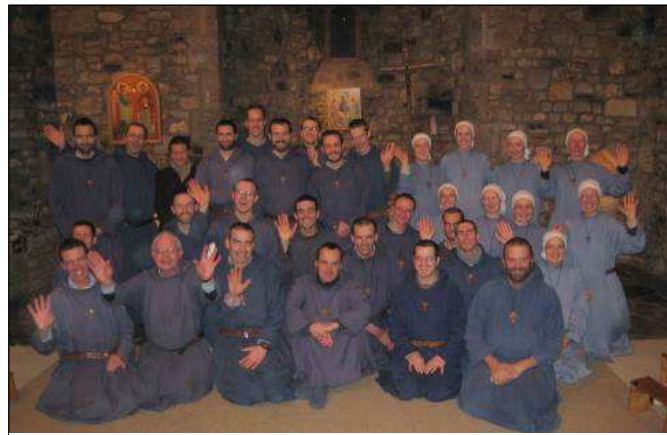
Šeimyninis susitikimas su broliais iš Lietuvos ir Kongo