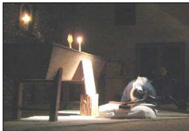
Kryžiaus pagarbinimas pas seseris Pondrome

Kartu su savo „kraujo“ šeima pastaraisiais mėnesiais išgyvenome labai stiprių akimirčių su tėčiu. Jo „Gražioji meilė“ – taip jis mėgo vadinti mamą, – danguje jau treji metai. Jis tiek kartų mums kartojo: „ kaip gera paprastai kalbėti apie mirtį. Aš nebijau mirties. “ Ypač jį lydėjo Mergelė Marija. Beje, neseniai jis buvo gavęs dovanų nuostabią „Švelnumo Motinos“ ikoną, kurią pasistatė savo svetainėje, matomoje vietoje, kad galėtų ją gėrėtis iš įprastinės savo vietos. Ji jam buvo didelė paguoda.