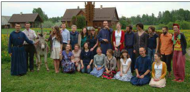
Šv. Damijono grupės nariai per Sekmines atnaujino savo įsipareigojimą.