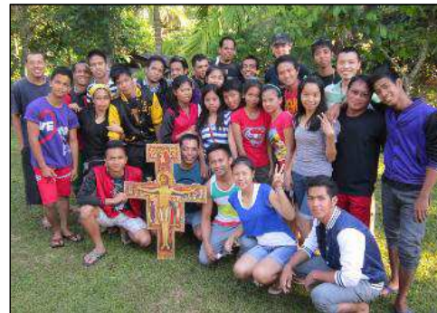
Šv. Damijono grupės jaunuoliai

Ant jo krepšinio marškinėlių vaizduojamas Tikėjimo metų logotipas, su pripieštu šv. Damijono kryžiumi bei komandos pavadinimu „San Damiano“. Išties mūsų jaunuoliai labai drąsūs, nes dažnai kaime juos vadina „davatkomis“. Tarp dvidešimties komandų mes laimėjome gražiausių marškinėlių kategorijoje. Pikti liežuviai tauškia, kad tai tebus vienintelis mūsų prizas, nes jaunuoliai nedaug treniravosi, mat iš tiesų šie jaunuoliai labai užimti: malda, rankų darbas, mokslai ir misijos. Tačiau mūsų šie jaunuoliai labai pasiryžę, šią savaitę jie dukart kėlėsi penktą rytą, kad prieš rytinę maldą tyloje 6.30val. dar valandą pasitreniruotų.