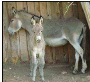
Birželio mėn. gimė asilukė, kuri džiugina vaikus.

Tiberiados broliai širdingai dėkoja visiems ir meldžiasi už visus, kurie paremia bendruomenės misiją. Prie paramos galite prisidėti skirdami 2% pajamų mokesčio Tiberiados bendruomenei.