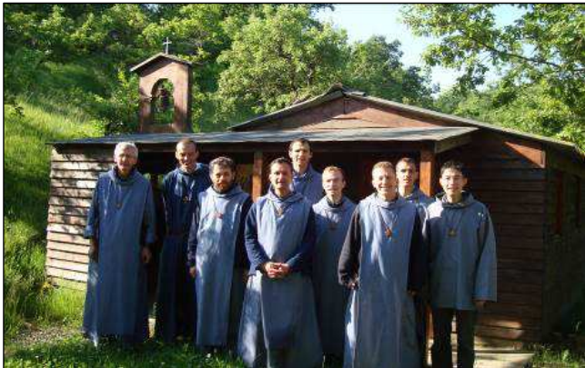
Susitikimas su Avinėlio bendruomenės broliais Prancūzijos pietuose

Birželio mėnesį dešimčiai dienų buvau išvykęs į Prancūzijos pietus susitikimui su keletu bendruomenių. Labai turiningi buvo ir susitikimai, išgyventi tranzuojant. Kartą sustojo viena musulmonų šeima, kuri turėjo daugybę klausimų apie katalikų Bažnyčią, apie skirtumus tarp Senojo ir Naujojo Testamento. Jie buvo labai dosnūs ir atidavė man savo pietų maistą, po to išleido mane patogioje vietoje, kad galėčiau tęsti kelionę. Vėliau sustojo viena moteris, ką tik nuvėžusi savo vaikus į skautų stovyklą. Situacija jos šeimoje buvo sudėtinga, be to, ji ruošėsi išsikraustymui, tad pasimeldėme kartu.