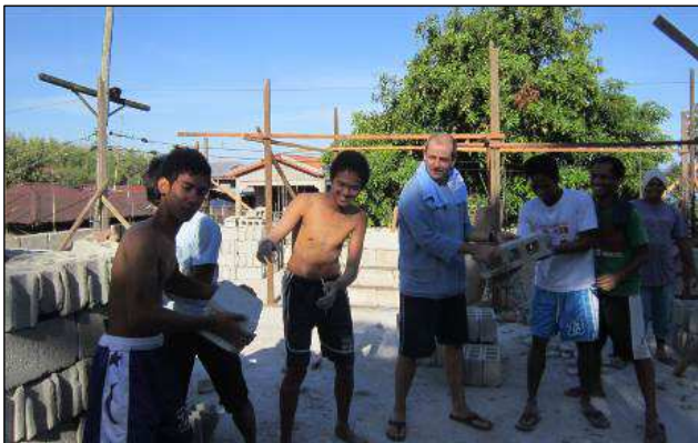
Statybų darbai naujojoje Sapang klinikoje.