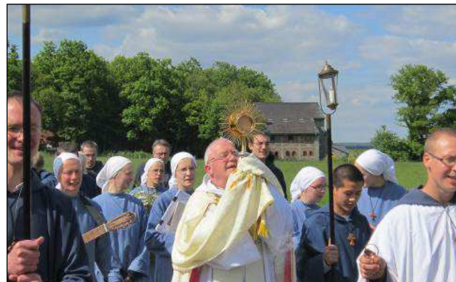
Švenčiausiojo Sakramento išskilmės procesija Lavaux Sainte Anne. Viešpats pasirinko, kad duona virstų Jo kūnu ir kad tokiu būdu mes galėtume su Juo susijungti kiekvienos eucharistijos metu.