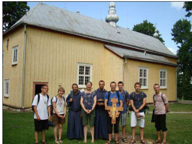
Šv. Damijono grupės ir brolių žygis palei Nemuną į Lietuvos Jaunimo Dienas Kaune.