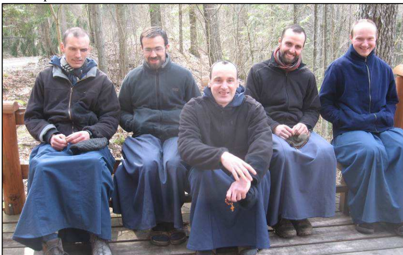
Broliai bendruomenės išvykos metu.