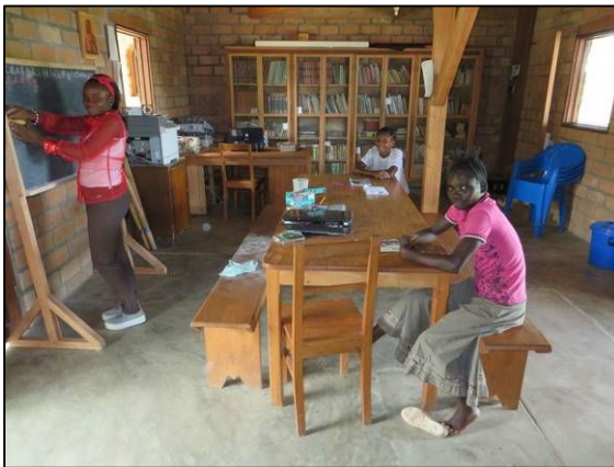
Šv. Bakitos socialinis centras

Per brolius Baltriškėse mes jums ir toliau perduosime žinias apie Gailestingumo darbus. Čia matote mūsų šv. Bakitos socialinį centrą, kuriame norime teikti pagalbą ir kitiems pažeidžiamiems žmonėms. Jau dabar tariu jums ačiū.