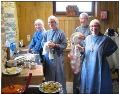
Linkėjimai nuo seserų iš Belgijos!

Po vieno evangelizacijos vakaro Briuselyje aš priėjau prie vienos afrikietės, kuri tyliai rinko giesmynus, paliktus ant suolų. Mes buvome vos bepradėjusios kalbėtis, kai ji man šypsodamasi tarė: „Žinai, kiti mane laiko išprotėjusia!“ Ir ji pasidalino savo skausmu dėl jaunesniojo sūnaus, mirusio prieš kelis mėnesius. Beklausydama jos, aš iš kišenės išsitraukiau paveikslėlį su šv. Jonu, Jėzaus mylimuoju mokiniu, prisiglaudusiu prie Jėzaus širdies, ir padaviau jį moteriai. Žvelgdama į paveikslėlį, ji pasakė: „Kaip aš norėčiau būti kaip Jonas, arti prie Jėzaus širdies, kad girdėčiau: „Aš tave myliu, aš tave myliu, aš tave myliu...“ su kiekvienu Jo širdies dūžiu. Ir aš jam pasakyčiau: „Atleisk, atleisk...“, nes kai mes ką nors mylime, tai net mažiausi dalykai mus labai skaudina.“