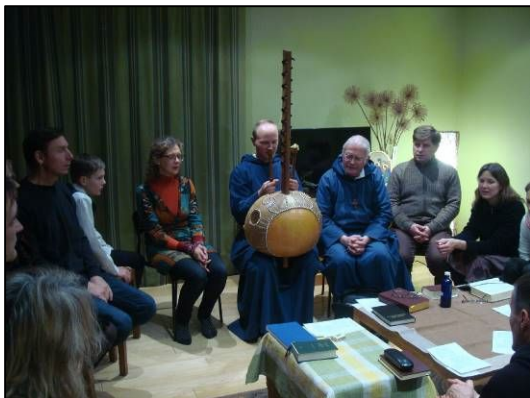
Vakaras šeimų maldos grupelėje