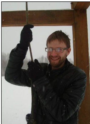
Antanas visus kviečia į maldą

Į šv. Jono Krikštytojo metus atvažiuavau, galima sakyti, tiesiai iš mokyklos suolo. Šie metai man – gyvenimo mokykla. Jie moko mane tikro gyvenimo. Būdamas mokykloje, nelabai išmokau to, kas reikalinga tikrame gyvenime, dvasiniame gyvenime. O čia per vieną savaitę galiu išmokti daugiau, nei per visus dvylika metų mokykloje. Galiu išmokti, kas man naudinga, o ne tai, ką kiti nori, kad mokėčiau. Šie metai man yra puikus pasiruošimas tikram suaugusio žmogaus gyvenimui. Tai geriausias būdas išmokti gyventi su Dievu.