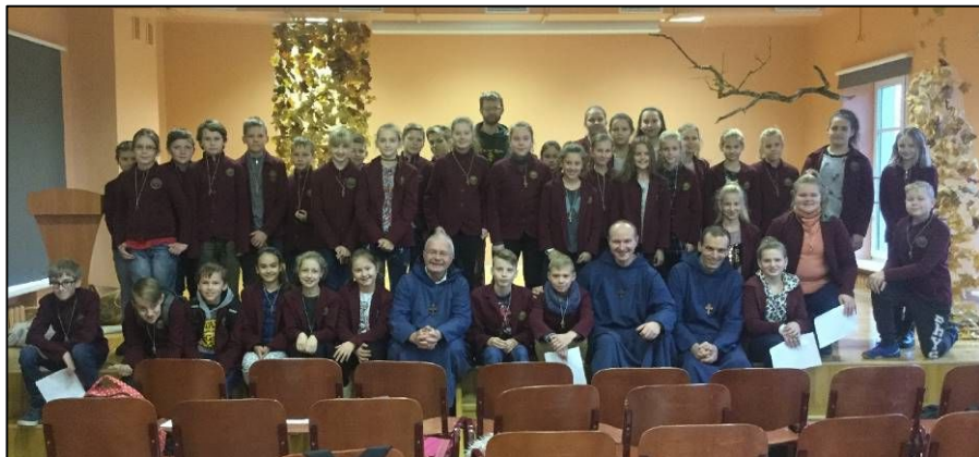
Su Kretingos pranciškonų gimnazijos mokiniais

Grįžus į Baltriškes, man išpūdį padarė sodas, o ypač du medžiai. Jie buvo aplipę obuoliais. Nepaisant to, kad obuoliai buvo sušalę, aš jų paragavau, ir jie buvo labai skanūs. Šie vaismedžiai man priminė Gyvybės medį, pasodintą tarp dviejų upės atšakų, duodantį vaisių dvylika kartų per metus, o šio medžio lapai buvo vaistas visoms tautoms (Apr). Šis Gyvybės medis – tai Kristaus kryžius, meilės kryžius. Iš tiesų derlius Lietuvoje buvo labai gausus. Man tai konkretus Jėzaus įvaizdis, duodantis tiek daug malonių, dovanų, išgydymų per sakramentus, šeimos gyvenimą, Žodį. Priimkite ir skinkimės gausius Išganymo vaisius. Kristus šiais Naujaisiais metais tesiunčia jums Šventąją Dvasią, atsiverkime jai maldoje ir per gailestingąją meilę.