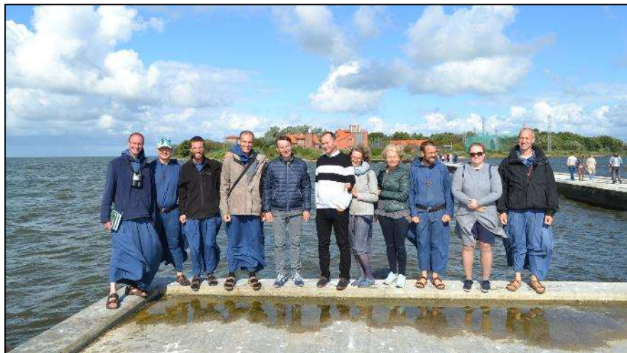
Rekolekcijų metu susitikimas su šeimomis Ventės Rage

Mieli maldos draugai, dėl vieno dalyko esu tikras – vasarą Baltriškėse tikrai šis tas dedasi. Kaimelis Lietuvos užkampyje staiga tampa panašus į avilį, nes nuolat atvyksta ir išvyksta žmonės, taip pat čia nudirbami dideli darbai. Bažnyčios Tėvai dažnai lygindavo Bažnyčių su aviliu: gyvenimo apstumas, gardus darbo rezultatas, šeimą vienijanti motinėle – Kristaus įvaizdis. Jonas Chrizostomas rašė: „Kodėl bitė vertinama labiau nei kiti gyvūnai? Argi nematote? Ne tiek dėl to, kad ji dirba, kiek dėl to, kad ji dirba dėl kitų. Voras irgi dirba ir audžia kuo ploniausiai; voratinkliai, kuriais jis padengia mūsų sienas, yra puikesni už mikliausios moters darbą; vis dėlto tas padaras nėra kilnus, nes jo darbas mums neturi jokios naudos. Tokie yra visi, kurie dirba tik dėl savęs.“