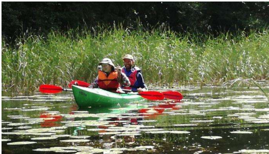
Dviračiais, baidarėmis judame dėl Jėzaus (Gražutės parke)

Didžiausi linkėjimai iš Belgijos! Keletas žodžių apie paauglių žygį stovyklą. Nuotykiškai prasidėjo dar prieš stovyklą. Reikėjo įsisprausiti į 50 žmonių limitą. Todėl didžiuosius paauglius išsiuntėm pas st. Damiano jaunimą. Po to vienas po kito pradėjo atkrintinėti vadovai (vienas susirgo, kitas turėjo problemų su mokslais ir t.t) galiausiai vadovų komandą sudarė 5 broliai iš 5 skirtingų šalių (Brolis Kyrilas buvo mūsų kapelionas), 1 sesė, 1 postulantė ir 3 vaikinai- vadovai.