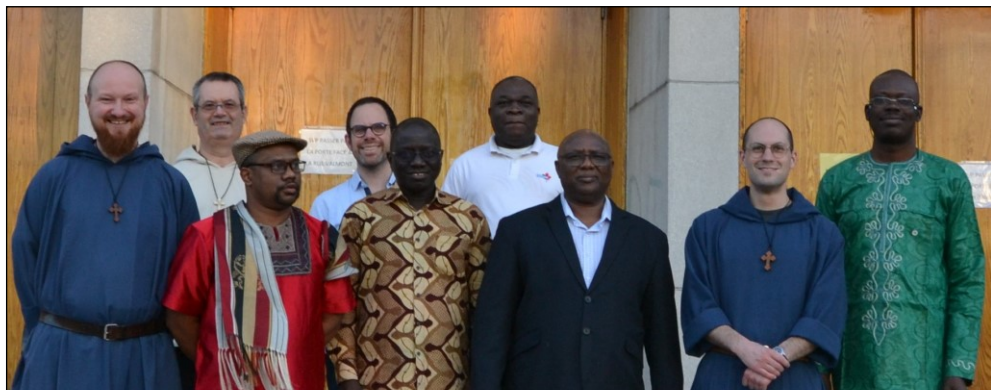
Skirtingų pasaulio šalių studentai - turtinga kultūrų įvairovė

judėti į priekį ir priimti naujus sprendimus. Džiaugiuosi, kad nusprendžiau čia mokytis. Matau, jog esu geriau pasirengęs padėti žmonėms suvaldyti emocijas, suvokti savo stipriąsias puses, jėgas konkrečiose patirtyse ir padėti ardyti vidines sienas, kad būtų galima pastatyti taikos tiltus.