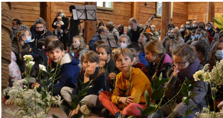
Pjūties vaikai maloniai klausosi padėkos broliams Mišiose (21-10-17).