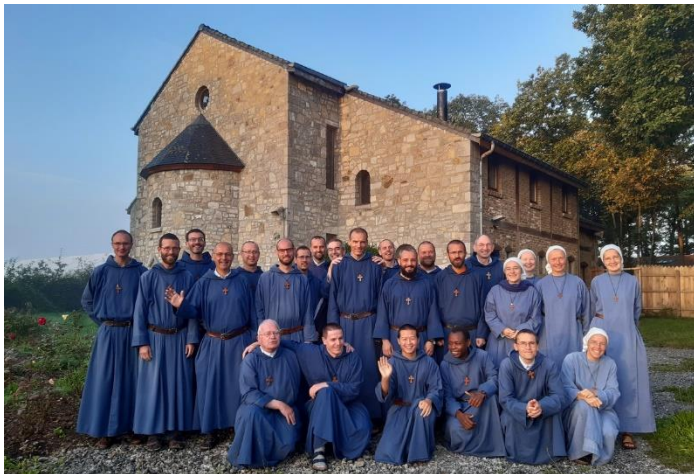
Kapitulos dalyviai (rugsėjį 2021 m.). Tave meldžiamės, Viešpatie, už naujus pašaukimus savo Bažnyčiai!

Taip pat Viešpatie pavedam Tau visus žmonės, kurie ieško gyvenimo kelio, kreipiasi pagalbos mūsų bendruomenei. Tegul Šv. Dvasia juos apšviečia ir veda.