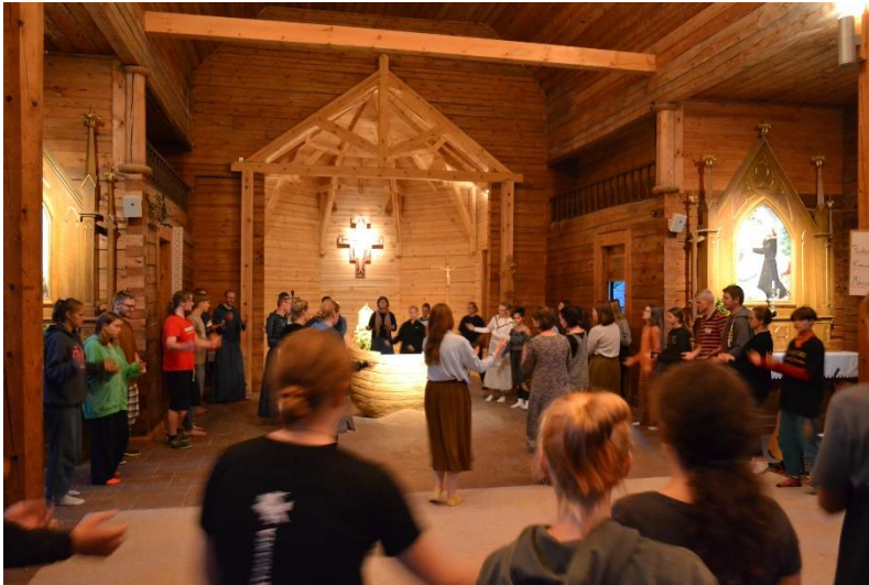
Šokiai ir malda vasaros jaunimo stovyklą.