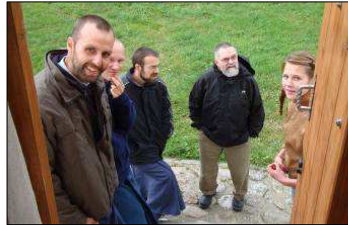
Jauna mergina mums aprodinėja Južinų bažnyčią per ekskursiją.

Viduramžių Bažnyčia yra labai įvairi: ji yra šventa, bet tuo pačiu metu ir nuodėminga, apjuodinta skaudžių įvykių. Nesvarbu ar tai būtų Kryžiaus žygiai, ar Inkvizicija, iš viso šito vėliau buvo sukurtas mitas, kuris ir apima visus šiuos istorijos puslapius. Tačiau tai puiki proga prisiminti žmogaus nuodėmę ir išanalizuoti savo pačių gyvenimą, kad jis visada atitiktų tikro krikščionio reikalavimus. Didžiausios mūsų tėvų klaidos yra įspėjimas mūsų šiandieniam gyvenimui. Kaip bebūtų, šios skaudžios akimirkos mūsų Bažnyčiai, parodo kiek