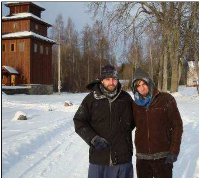
Brolio Mišelio džiaugsmas susitikti su broliu

Aš, kaip parapijietė ir kaip Švento Damijono grupės narė, jaučiu tam tikrą pareigą, bet daugiau didžiulį norą tai padaryti. Manau, kad jau subrendau tam. Noras įkurti antrąją maldos grupelę Utenoje atėjo visai netikėtai. Tai buvo greičiau Šventosios Dvasios pastūmėjimas ir drąsos įkvėpimas. Visada buvau tvirtai įsitikinusi, jog tikėjimas yra duotas kiekvienam žmogui, tačiau ne visi iškart sugeba atverti savo širdis Dievui ir jį įsileisti, todėl žmonės, atradę tikėjimą, visada turi drąsinti kitus ir dalintis savo džiaugsmu. Pati atradusi tikėjimo malones, būdama nemažą laiką su Tiberiados bendruomene, supratau, jog pagaliau ir aš subrendau liudyti Dievo buvimą tarp mūsų ir ne tik pati semtis stiprybės iš Dievo, bet ir parodyti žmonėms, kokios stiprybės gali duoti mūsų Viešpats. Atsakomybė už maldos grupelę man yra kaip mano pačios atsидavimo įtvirtinimas. Maldos bendrystė padės augti tiek man, tiek žmonėms, kurie ateis kartu melstis!