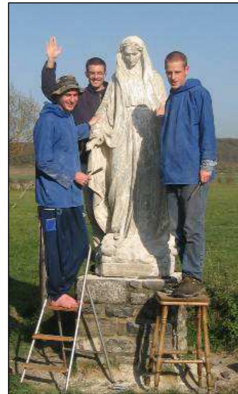
Statulos anksčiau stovinčios virš ligoninės, renovacija.