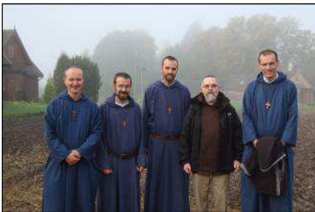
Broliai su Tėvu Žoel, trapistu iš Norvėgijos